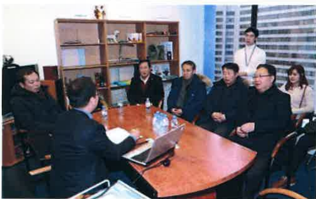
모스크바 무역관(KOTRA) 방문(1)