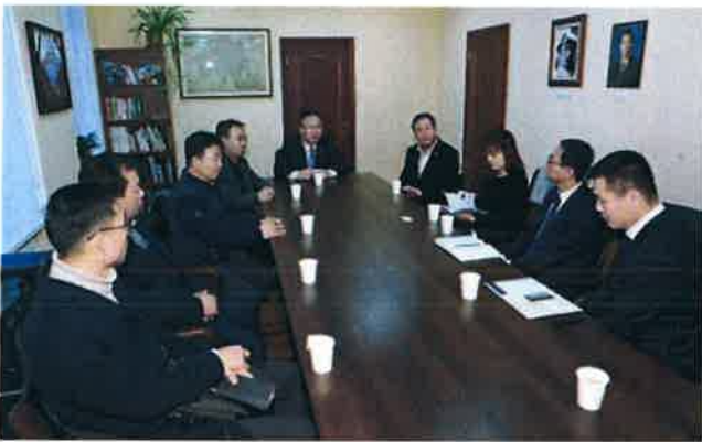
상트 페테르부르크 총영사관 방문-1