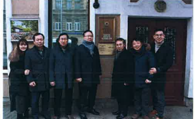
상트 페테르부르크 총영사관 방문-2