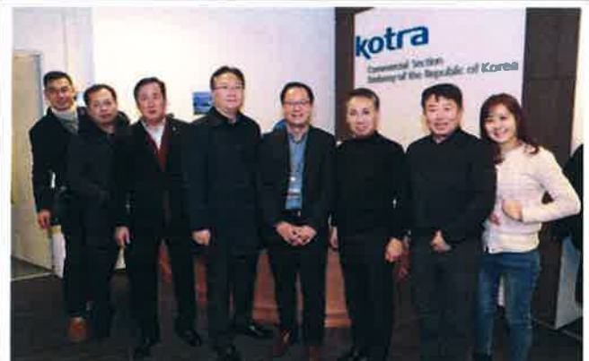
모스크바 무역관(KOTRA) 방문(2)