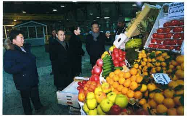
러시아식 전통시장 방문